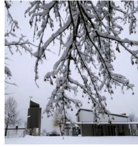
T = Tuchenbach