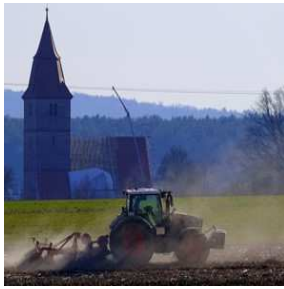
V = Veitsbronn