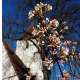
O = Obermichelbach