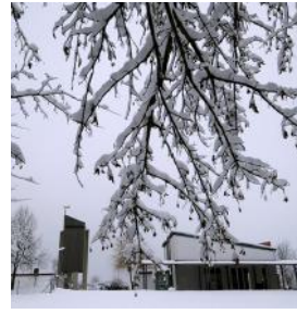
T = Tuchenbach