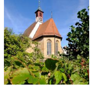
P = Puschendorf