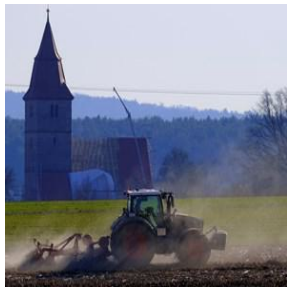
V = Veitsbronn