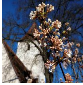
O = Obermichelbach