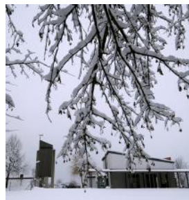
T = Tuchenbach