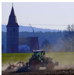
V = Veitsbronn