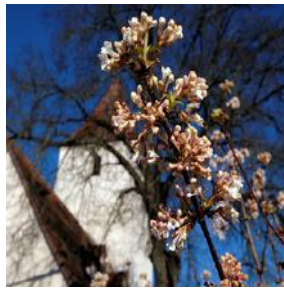
O = Obermichelbach