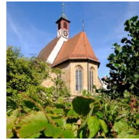
P = Puschendorf