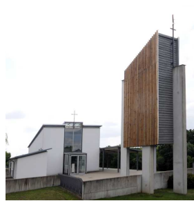
T = Tuchenbach