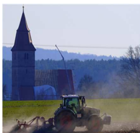
V = Veitsbronn