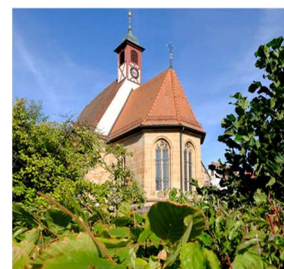
P = Puschendorf