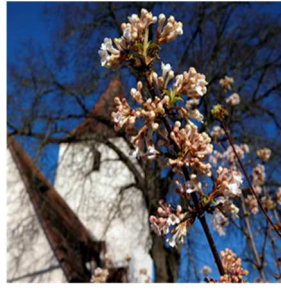
O = Obermichelbach