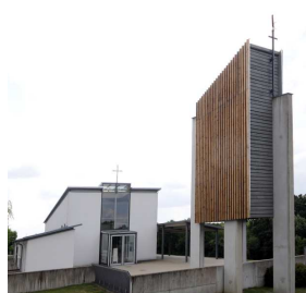
T = Tuchenbach