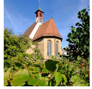
P = Puschendorf