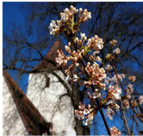
O = Obermichelbach