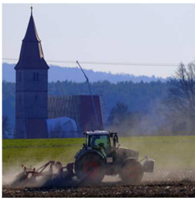
V = Veitsbronn